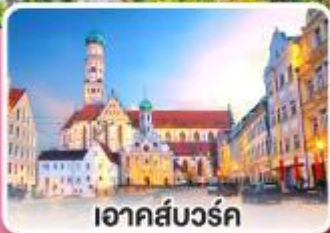
เอาคส์บวร์ค