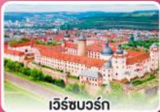
เวิร์ชบวร์ค